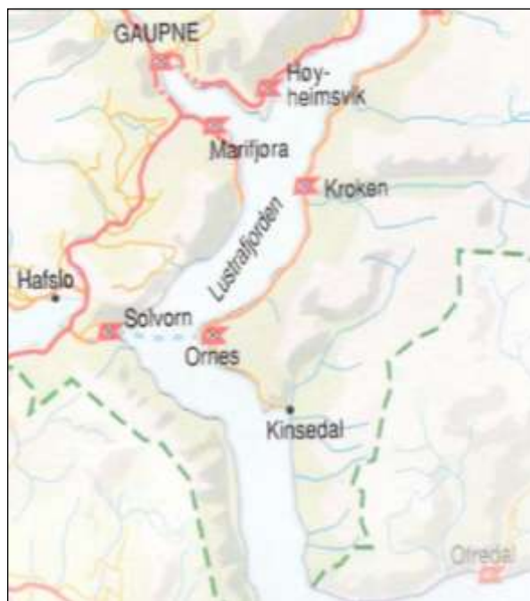
Solvorn ligger idyllisk til ved Lustrafjorden i Indre Sogn.

Gjennom diverse arkeologiske funn på gamle boplasser har man kunnet føre bevis for at det må ha bodd folk i Solvorn helt tilbake til yngre jernalder (550-1030 e.Kr.). I skriftlige kilder er Solvorn første gang nevnt i 1333. Etter sigende skal navnet Solvorn bety tangoddane , som ganske sikkert gjenspeiler hvordan strandsonen i Solvorn har vært fra gammel tid.