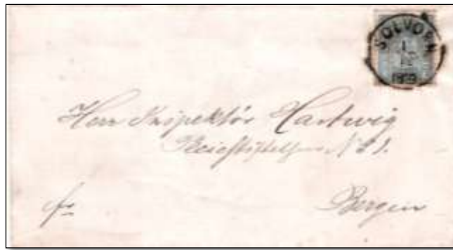
Korrekt frankert innenlandsbrev, stemplet Solvorn 1.12.1869. Brevet har gått med D/S "Framnæs" i ruten mellom Indre Sogn og Bergen.