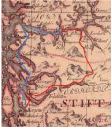
Figur som viser mulige ruter for brevet. Langs traseen til senere Trondhjemske postvei (blå) eller postveien Bergen-Christiania (rød)