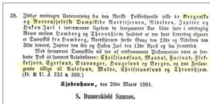
Det danske cirkulære

Brevet var et såkaldt sommerbrev, det vil sige, at det blev sendt i den regulære dampskibs-sæson. Man kunne derfor spare den dyre porto for transit gennem Sverige. Der var oven i købet en direkte rute fra Hamborg til den norske vestkyst. Et dansk cirkulære af den 26. marts 1861 meldte, at breve fra Hamborg til adresser mellem Christianssand en Bergen (for eksempel til Mandal), skulle sendes direkte med de private norske dampskibe hver lørdag. Breve til byer mellem Bergen en Trondheim kunne gå ad samme rute, men kun på forlangende.