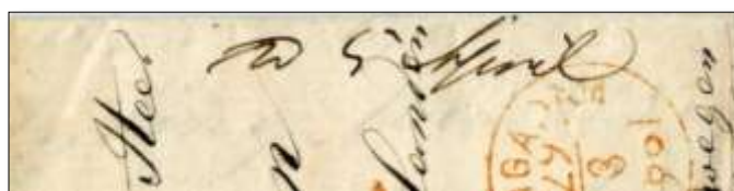
Påskriften "D 5 April"

Brevet var et såkaldt sommerbrev, det vil sige, at det blev sendt i den regulære dampskibs-sæson. Man kunne derfor spare den dyre porto for transit gennem Sverige. Der var oven i købet en direkte rute fra Hamborg til den norske vestkyst. Et dansk cirkulære af den 26. marts 1861 meldte, at breve fra Hamborg til adresser mellem Christianssand en Bergen (for eksempel til Mandal), skulle sendes direkte med de private norske dampskibe hver lørdag. Breve til byer mellem Bergen en Trondheim kunne gå ad samme rute, men kun på forlangende.